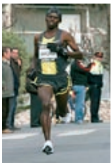
Samuel Wanjiru torna

Poc abans de les 11 del matí de diumenge, Granollers, les Franqueses i la Garriga viuran una matinal atlètica de primer nivell esportiu i de gran participació popular. La 25a edició de la Mitja Marató traurà al carrer 8.500 atletes que, al llarg de 21,097 quilòmetres disputaran la Mitja, i encara un miler més que faran el Quart de Mitja i no passaran més enllà de Granollers. Un extens monogràfic repassa