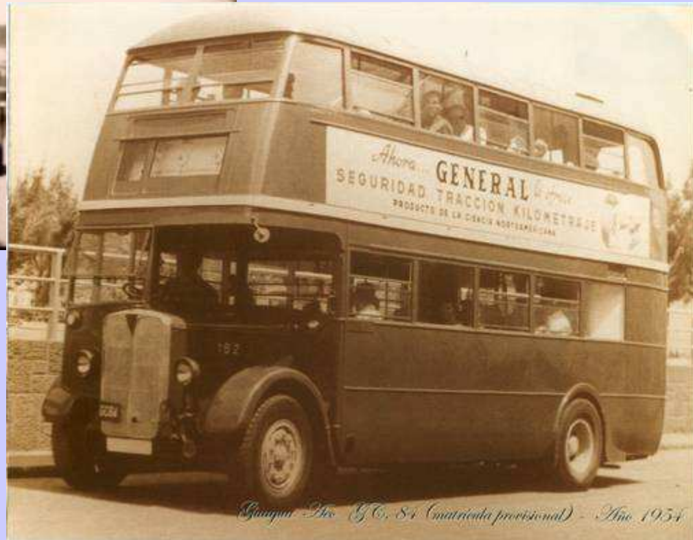
Chrysler Div. G.C. 84 (matriculada provisional) - Año 1954