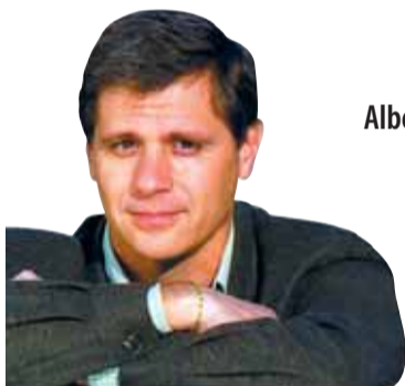
Alberto Fernández Díaz PP

La crisi continua i els governs de Barcelona, Catalunya i Espanya continuen absents. Mentrestant, l'atur creix, les hipoteques i els preus s'apugen, i als pensionistes i famílies cada vegada els costa més arribar a fi de mes, o altres simplement no hi arriben. El Govern Municipal ha presentat el seu programa de govern (PAM), per al període 2008-2011, sense tenir en compte la crisi econòmica actual.