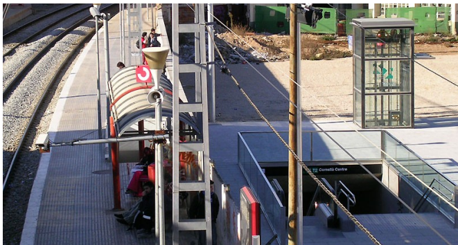
Mur que separa l'accés al Metro i tramvia de la via 1 del tren a Cornellà.

INTERCANVIADORS. Exigim l'acabament de les obres interrompudes als intercanviadors de Martorell Central (Rodalies – FGC), Ernest Lluch (Bus – Metro L5 – Tram) i Intermodal del Prat (Bus - AVE – Rodalies - Metro) així com la integració dels autobusos i desdoblament d'accesos als intercanviadors actuals de Cornellà Centre (Bus – Tram – Rodalies - Metro) i Sant Joan Despí (Bus – Tram – Rodalies).