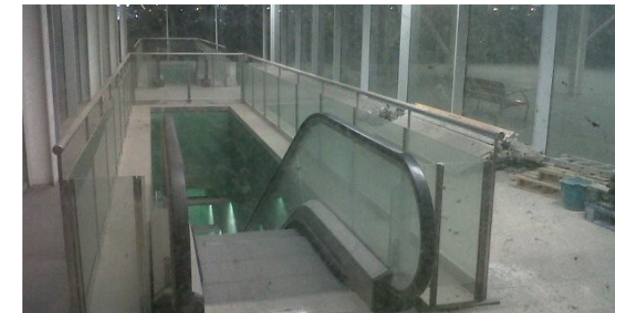
Tant l'estació de l'AVE del Prat (foto), paral·lela a les Rodalies, com el túnel de Metro fins el nou aeroport, estan construïts però sense servei.

UNA SOLUCIÓ A CURT TERMINI PER COMUNICAR L'AEROPORT. Obrir inicialment la L9 del Metro -que ja té el túnel construït- com a llançadora entre la T1, T2 i l'estació intermodal del Prat. Cal donar servei a aquesta estació obrint al públic les andanes -ja construïdes- de la línia d'alta velocitat i fent parar tots els trens regionals exprés a l'estació de Rodalies actual. Per fer-ho proposem allargar la línia Portbou-BCN fins l'aeroport.