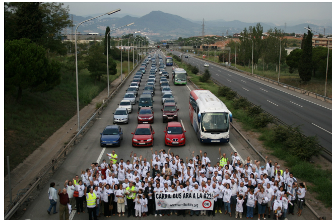
La implantació d'un carril bus a la B23 (foto) és possible amb molt poca inversió econòmica, només cal acceptar límits més coherents de velocitat.

SERVEI DE BUS EXPRÉS. Reclamem la connexió de la zona del Delta de i la part alta de la comarca amb la comarca mitjançant autobusos exprés protegits a la B-23 (Diagonal) i la C-31 (Gran Via) respectivament. També apostem per protegir els autobusos en eixos intracomarcals actualment congestionats, com per exemple l'eix Sant Just – El Prat (L10), el Prat – Sant Boi, o Cornellà – Castelldefels. (L96).