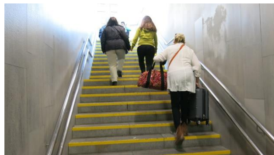
Una dona carregada amb equipatge davant el no funcionament de l'equip comença a pujar el primer dels tres trams dels 30 graons.