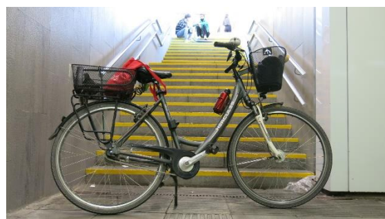
Intermodalitat bici + tren, no hi ha res millor que carregar amb la bicicleta escales i cames amunt...