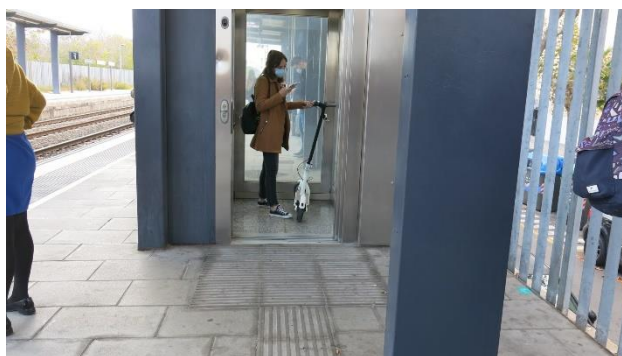
Des del passat 2 de novembre, l'ascensor torna a estar operatiu