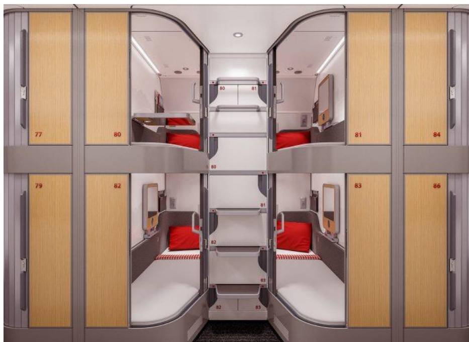
Imatge promocional dels nous trens nocturns comprats per ÖBB.

ferroviaris nocturns, al mateix temps que cal imposar mesures fiscals sobre el combustible d'aviació per acabar amb el dumping que gaudeix el low cost aeri.