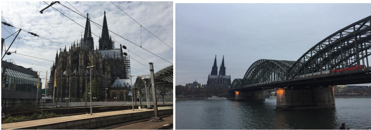
Exemple d'integració urbana del ferrocarril a la ciutat de Colònia.

O el cas de l'estació central de Colònia (Köln-Hauptbahnhof) que és en superfície i al costat mateix de la Catedral (la més visitada d'Alemanya i patrimoni mundial de la UNESCO).