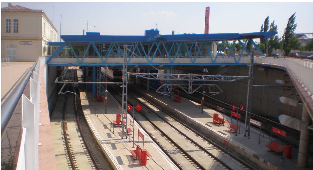
Vista de l'estació de Vic, després del soterrament en trinxera.