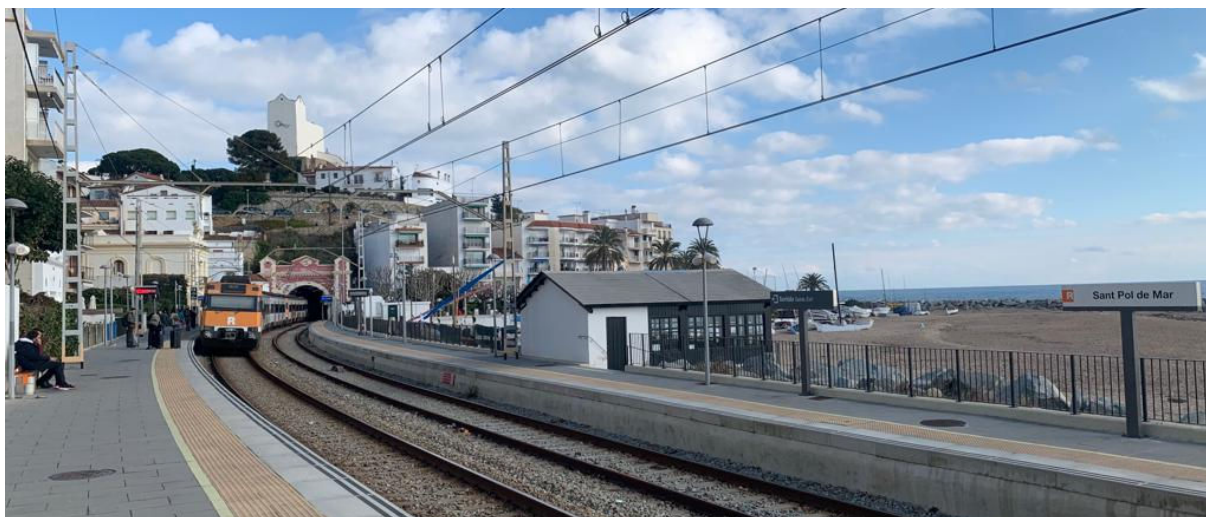
Exemple d'integració urbana del ferrocarril a la ciutat Sant Pol.

O també en alguns municipis del Maresme, on l'impacte que té la infraestructura ferroviària no és comparable amb la que pot tenir una de viària. Sant Pol de Mar té integrat el ferrocarril a la trama urbana i a la mateixa fisonomia del poble no s'entendria sense aquest transport.