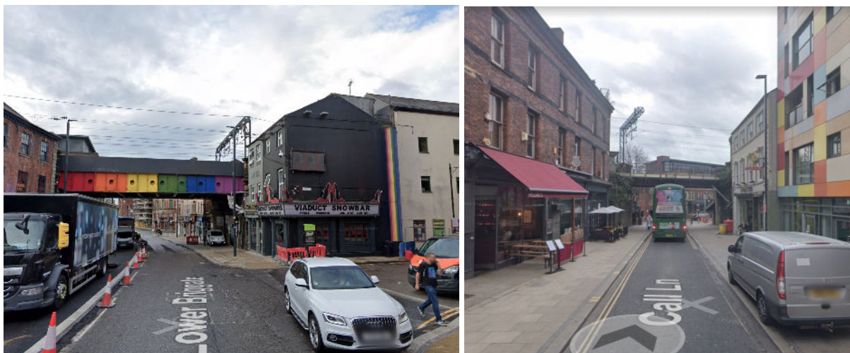
Exemple d'integració urbana del ferrocarril a la ciutat de Leeds.

Per últim, el cas de l'estació de Leeds (UK, 700.000 habitants), on s'han adossat al viaducte per on passen les vies, edificis amb equipaments privats dedicats amb activitats que toleren bé el soroll i les vibracions, com bars musicals, perruqueries i botigues.